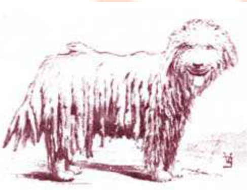
Lompos. Az Alföldön készült felvétel alapján készült rajz. Buzzi nyomán.

Pápai Páriz (1767), majd Pethe (1815) külön-külön leírja a két őrző-védő pásztorkutyánkat. Az 1840-beli F. Treitschke -féle leírást fogadhatjuk el elsőnek, amely a fajta jellemzőit rögzítette. Ezt követte Lónyai 1901-es, Buzzi 1907-es, Monostori 1909-es, majd Raitsits 1921-es leírása.