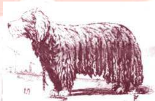
A komondor ideális típusa Buzzi leírása alapján

Magyar pásztorkutyafajtáink kedvelői közül a komondortenyésztők szervezkedtek leghamarabb sportegyesületbe, és 1924-ben megalakították a „Komondor Egyletet”. Azóta több mintaleírás készült a komondorról. A legtartósabban volt érvényben az 1935-ös Anghi -féle mintaleírás. 1935 elejére törzskönyvezve volt „A Magyar Kutyák Törzskönyvébe ” 1700 kuvasz, 992 puli, 293 pumi, 972 komondor. Az arány azt mutatja, hogy ekkor még a kuvasz után a törzskönyvezett puli és a komondor egyformán elterjedt volt. A jelenleg érvényben lévő standard elődje 1960-ban készült, amelyet az FCI No.53/b szám alatt ismert el. Ehhez részletes mintaleírást 1966-ban készítettek (Ócsag, 1987).