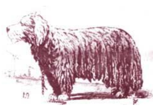
A komondor ideális típusa Buzzi leírása alapján

Magyar pásztorokutyafajtáink kedvelői közül a komondortenyésztők szervezkedtek leghamarabb sportegyesületbe, és 1924-ben megalakították a „Komondor Egyletet”. Azóta több mintaleírás készült a komondorról. A legtartósabban volt érvényben az 1935-ös Anghi -féle mintaleírás. 1935 elejére törzskönyvezve volt „A Magyar Kutyák Törzskönyvébe ” 1700 kuvasz, 992 puli, 293 pumi, 972 komondor. Az arány azt mutatja, hogy ekkor még a kuvasz után a törzskönyvezett puli és a komondor egyformán elterjedt volt. A jelenleg érvényben lévő standard elődje 1960-ban készült, amelyet az FCI No.53/b szám alatt ismert el. Ehhez részletes mintaleírást 1966-ban készítettek (Ócsag, 1987).