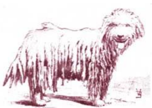
Lompos. Az Alföldön készült felvétel alapján készült rajz. Buzzi nyomán.

Pápai Páriz (1767), majd Pethe (1815) külön-külön leírja a két őrző-védő pásztorokutyánkat. Az 1840-beli F. Treitschke -féle leírást fogadhatjuk el elsőnek, amely a fajta jellemzőit rögzítette. Ezt követte Lónyai 1901-es, Buzzi 1907-es, Monostori 1909-es, majd Raitsits 1921-es leírása.